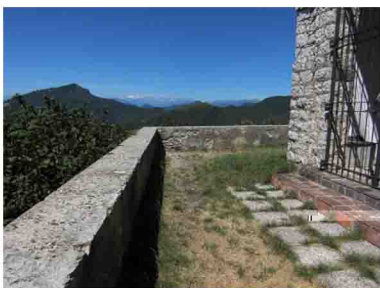
15. In una bella giornata il panorama è molto appagante, a picco sulla Valganna coi suoi laghetti e vista su Alpi e Prealpi.