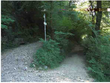
9. Bivio: su Monarco, giù Montallegro, a pochissimi passi da qui. Da questo punto e fino in cima si segue la "via normale".