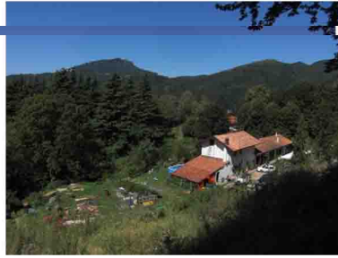
10. Sopra Montallegro vista su Campo dei Fiori e Chiusarella: l'agriturismo e la locanda sono entrambi chiusi. La cosa mette un po' tristezza perchè la loro posizione è decisamente ridente e favorevole. Speriamo in un recupero.