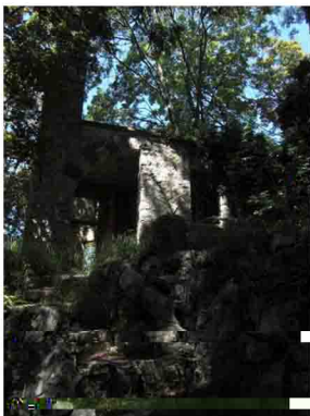
12. Rovine del rifugio "La Vedetta" presso la cima. Era appartenente a una società escursionistica milanese.