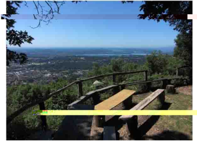
11. Proseguendo a zigzag per il comodo sentiero (evitando le due deviazioni) si giunge al poggiolo panoramico con splendida vista verso Varese, il lago e la pianura.