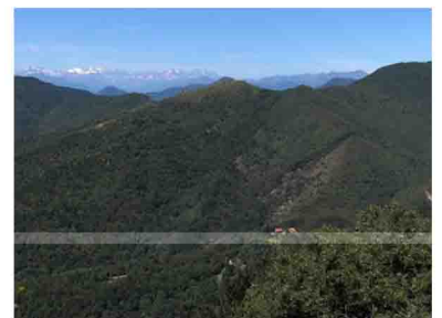
16. Si ritorna per lo stesso itinerario.