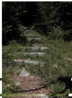
13. Scalini lungo l'ultimo tratto di salita...