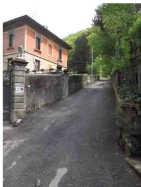
1. Ganna - Via degli Alpini, sul lato destro della SS 233 in direzione Ponte Tresa. Questa è la nostra partenza.

Sentiero che sarebbe di difficoltà MEDIO-FACILE, non fosse per lo stato di degrado in cui versa. Recentemente ripulito in molti suoi tratti dalle GEV del Parco Campo dei Fiori, dopo diversi anni d'incuria, sarebbe la giusta alternativa naturale all'auto per salire al Passo e quindi al Poncione. Resta da dire che un tratto di sentiero è crollato da diverso tempo, proprio a ridosso della strada asfaltata, dunque ben visibile anche a chi passa in auto, richiedendo un piccolo "sforzo" - peraltro evitabile - all'escursionista. Il sentiero parte dalla frazione Campubella e s'incrocia ripetutamente con la strada asfaltata che sale da Ganna, ove conviene lasciare l'auto in uno dei molti parcheggi disponibili. Tempo della salita, circa 45 minuti.