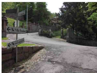
4. Continuare la salita...