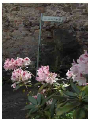
5. Raggiunta la bella chiesa di Campubella prendere questa via.