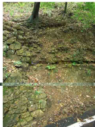
I casi son due: si passa a sinistra dell'albero appigliandosi meglio che si può, e tenendo conto che il terreno è franoso, dunque con evidente rischio di ruzzolare in strada.