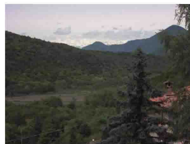
6. Passando vicino ad alcune villette si può godere di un buon panorama verso le cime della Valcuvia.