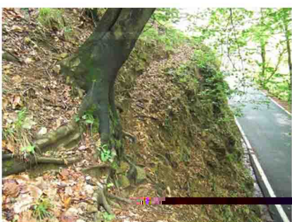
Chi non se la sentisse (la prudenza non è mai troppa) può evitare ogni rischio continuando su asfalto fino al "sentiero" successivo, che si trova dopo un tornante.