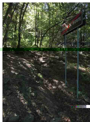
13. Si arriva infine poco prima dei cartelli stradali e del piccolo parcheggio al Passo del Tedesco (m.800). Da qui è possibile proseguire a sud per il Poncione, ad est per l'ormai prossimo Alpe Tedesco, e a nord per il Monte Val de' Corni od eventualmente il Piambello. Il ritorno avviene per la stessa via o tramite la strada asfaltata più volte incrociata lungo il percorso.