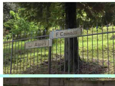
3. A sinistra per Boarezzo, a destra per la nostra meta.