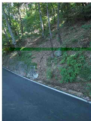
12. Ultimo breve taglio della strada.