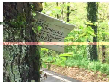
9. Facendo attenzione alle rade tracce si raggiunge il terzo tronco di sentiero, dotato di segnaletica molto datata.