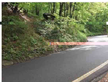
8. Dopo pochi minuti di salita nel bosco, s'incontra la prima deviazione, incrociando la strada asfaltata.