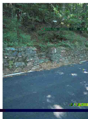
11. Qualunque sia stata la vostra scelta si arriva in questo punto, proseguendo senza problemi per il sentiero.