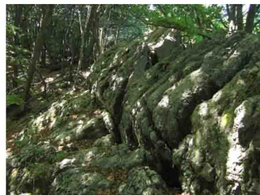
10. Carsismi nella faggeta. Subito dopo ritrovate le indicazioni per Poncione-Alpe Tedesco su cresta. Salendo a sinistra, invece, una fune metallica permette di salire sul Monte Minisfreddo.