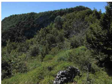
9. Ecco sua maestà il Minisfreddo... Da questo lato si può ben notare la sua ripida parete precipitante a valle.