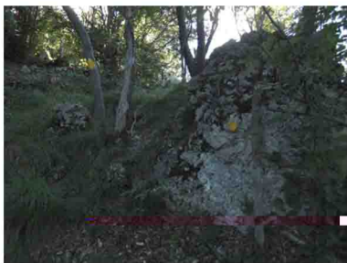
7. Dopo l'Arco salire un tratto ripido tra prati, cespugli e formazioni calcaree, seguendo sempre i bolli gialli. Poco oltre il sentiero sarà quasi sempre in falsopiano.