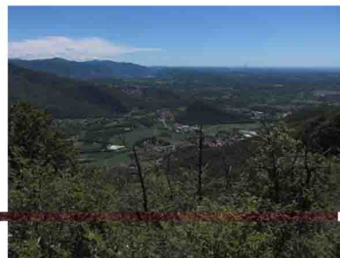
8. La luminosa Valceresio osservata lungo il tragitto.