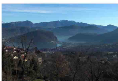
2. Si risale la strada asfaltata e questa è la bella vista che ci si presenta.