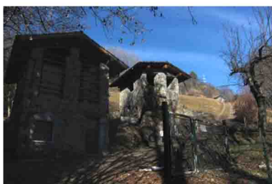
4. La strada finisce presso queste baite. Si prosegue alla loro sinistra per sentiero.