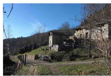
3. Salita davvero piacevole: belle baite, bei prati.