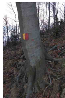
6. Superate le baite con un sentiero pianeggiante, si seguono le indicazioni per il "Trincerone" (segnali giallo-rossi). Il sentiero è stretto, invaso da rovi e un po' da interpretare: passato a fianco di una trincea malridotta sale seguendo i tornanti sul pendio.