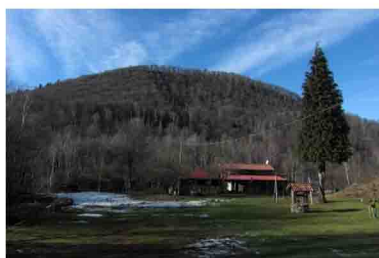
5. Si sale brevemente giungendo ai bei prati dell'Alpe Prada, sotto il Monte Mezzano che ci toccherà tra poco risalire in buona parte.