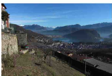
1. Partenza dalla bella chiesa di Viconago. Dalla piazzetta del paese s'imbocca la Via Monte Mezzano, che risale su asfalto passando tra alcune ville sopra il paese.

La cima del Monte Sette Termini è nota credo a parecchi turisti e gitanti, specie nella bella stagione, essendo raggiungibile in auto da due strade, ma farsela a piedi in ascensione o traversata - come in questo caso - ha davvero un altro sapore. Un percorso piacevole e in parte inedito, di difficoltà MEDIA, con tempo che si aggira intorno a un'ora e mezza, prevede la partenza dalla pittoresca e graziosa Viconago, arroccata su una panoramica terrazza di grande bellezza e luminosità, dal quale il Ceresio mostra e al tempo stesso nasconde la sua curiosissima forma, giocherellando tra le pieghe di dolci colli e austere e misteriose montagne.