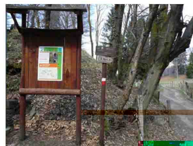
9. Alla fine del sentiero si giunge alle baite del Colle La Nave.