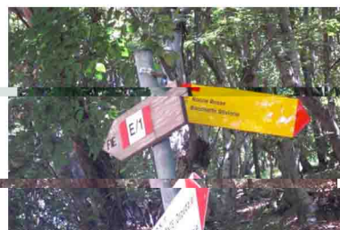
8. I cartelli indicano chiaramente la nostra meta.