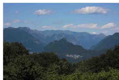
3. Il sentiero passa tra alcune graziose villette e cascate ben tenute, con lievi scorci panoramici