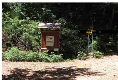
7. Giunti alla Bocchetta si trova un pannello illustrativo della Linea Cadorna.