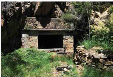
12. Una delle postazioni della Linea Cadorna lungo l'ultimo suggestivo tratto di salita.