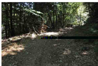
4. Sentiero largo e comodo, quasi interamente nel bosco.