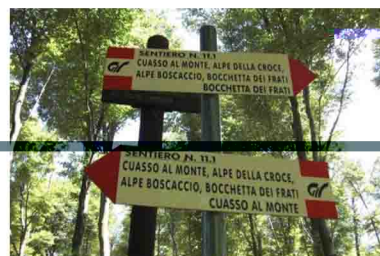
5. Cartelli poco prima dell'arrivo alla Bocchetta dei Frati.