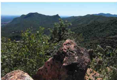
15. Gruppo del Minisfreddo, con la vistosa e inconfondibile punta del Poncione; sullo sfondo a destra il Campo dei Fiori...