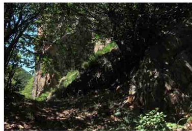
13. Si passa sotto questo grosso porfido e di lì in breve...