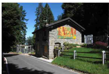
2. Attenzione. Passare alla sinistra della casa col murales e non a destra, da cui parte un altro sentiero.