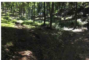
6. Subito dopo c'è la possibilità di tagliare con una scorciatoia a sinistra, altrimenti proseguire a destra per l'ultimo tratto di strada militare.