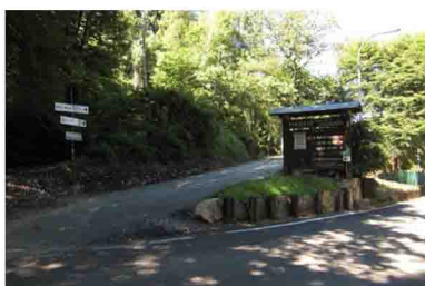
1. Forcorella di Marzio: questa la nostra partenza, all'altezza di un piccolo parcheggio prima della discesa verso Marzio.

Una di queste sale comodamente alla Bocchetta dei Frati, che mette in comunicazione con Cuasso al Monte per la lunga strada militare, e poi si porta ad una cima minore oscurata un po' dal vicino Monte Piambello. Tuttavia è una meta interessantissima per le sue pittoresche formazioni porfiriche, utilizzate dall'uomo per alcune delle fortificazioni più suggestive, benchè limitate, della Linea Cadorna.