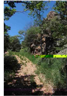
11. Si sale ora con più decisione e il panorama gradualmente si apre.