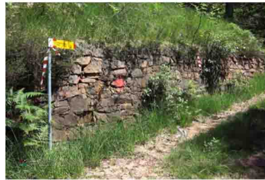
10. Ultima deviazione per la vetta: in questo punto si abbandona sulla destra il sentiero per la Bocchetta Stivione.