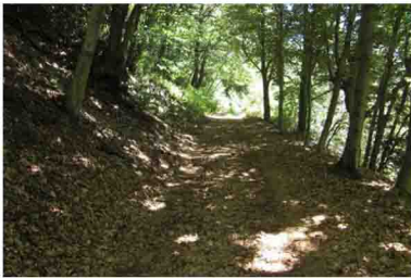
9. Il sentiero è sempre comodo.